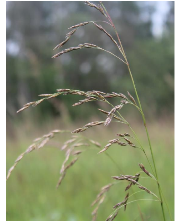
Rohr-Schwengel, Festuca arundinacea